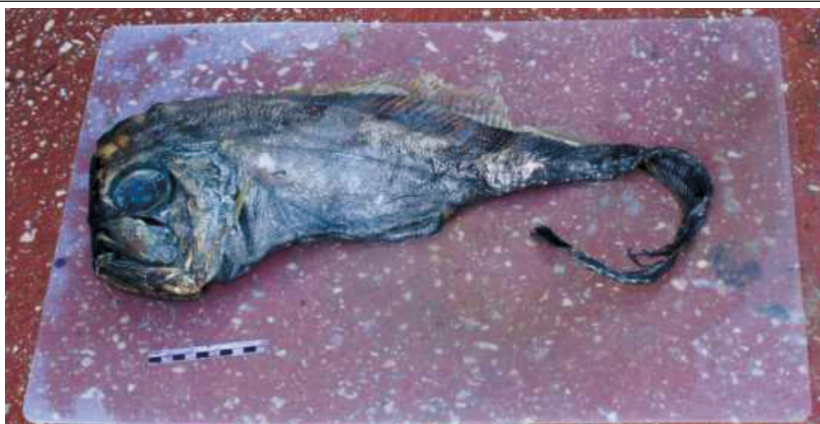
Fig. 2. Ejemplar 1 de 87,8 cm de longitud total, capturado el 30 de mayo del 2013 a 15 millas al sur de la isla de Cabrera (islas Baleares).

Fig. 2. Specimen 1 of 87.8 cm total length, captured on May 30, 2013 15 miles south of the island of Cabrera (Balearic Islands).