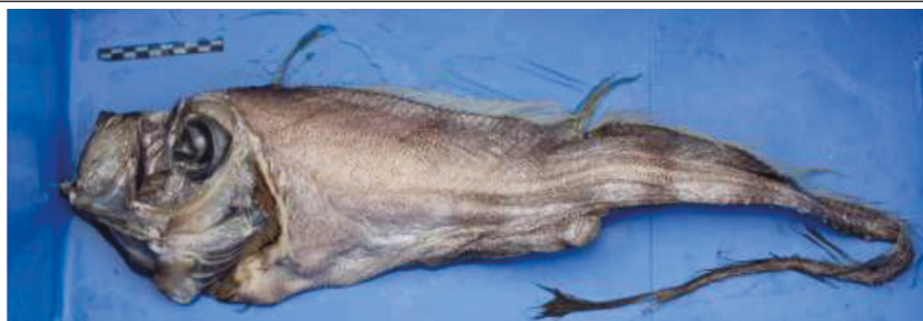
Fig. 3. Ejemplar 2 de 103 cm de longitud total, capturado el 16 de julio de 2014 a 35 millas al sur de la isla de Formentera (islas Baleares).

Fig. 3. Specimen 2 of 103 cm total length, captured on July 16, 2014 35 miles south of the island of Formentera (Balearic Islands).