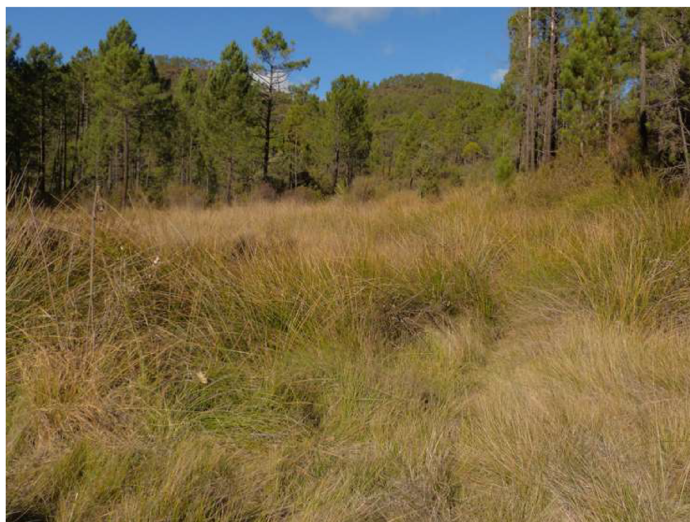
Fig. 2. Humedal donde habita Quickella arenaria en Villar del Humo (Cuenca, España).