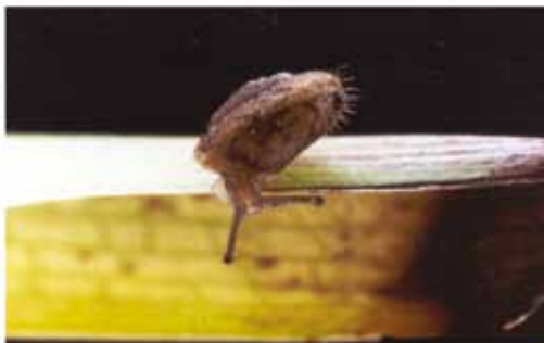
Fig. 4. Montserratina martorelli (Bourguignat, 1870), 2,5 x 5 mm. Localitat de recol·lecció 35.