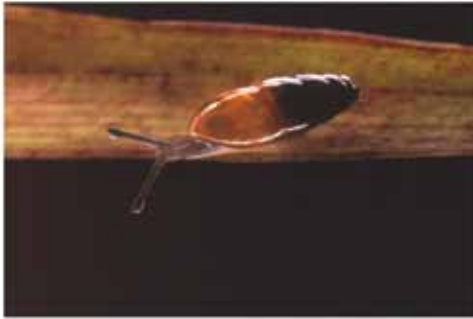
Fig. 2. Hypnophila boissii (Dupuy, 1850), 6 x 2 mm. Localitat de recol·lecció 35.